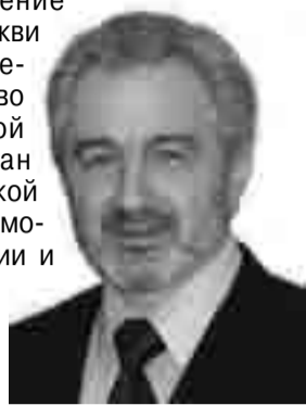
Епископ П. Н. Окара

Мы, Правление Российской Церкви ХВЕ, приняли решение объявить во всей Российской Церкви христиан веры евангельской 50 дней поста и молитвы в смиренности и ожидании Божьего действия.