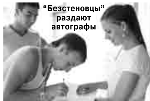
«Безстеновцы» раздают автографы

которых Бог особенно касался молодых сердец; ярмарка, где можно было зарабатывать местную «валюту», чтобы потратить ее потом на аукционе; спортивные мероприятия; мастерские рукоделия; морской праздник; Евровидение по-христиански, а также еще много-много интересного мог увидеть тот, кто побывал на «Без стен-2009».