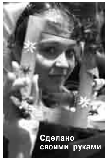
Сделано своими руками

Вифания, когда встречала некоторых «безстеновцев», так хотелось их обнять.....))))))))) Как все было замечательно)))))) Какая замечательная у нас молодежь))))))))) Я была на этом фестивале в первый раз, но, надеюсь, не в последний)))))) Очень благодарна Богу, что приобрела новых знакомых, а, возможно, и друзей, Господь знает))))