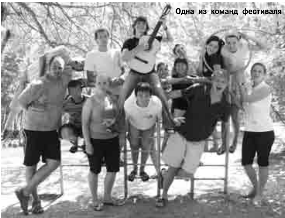
Одна из команд фестиваля

ной из них, а участники жили не просто в командах, а в странах. Фестиваль таким образом получился интернациональным: по территории базы разгуливали итальянцы, немцы и «всякие прочие шведы». «Безстеновцам» за очень короткое время удалось узнать о том, как делают зарядку и объезжают лошадей ковбои Запада, о том, что на Востоке день начинается с зеленого чая и сладостей, а на Юге не стоит удивляться, когда вместо приветствия тебе скажут: «Аллоха!».