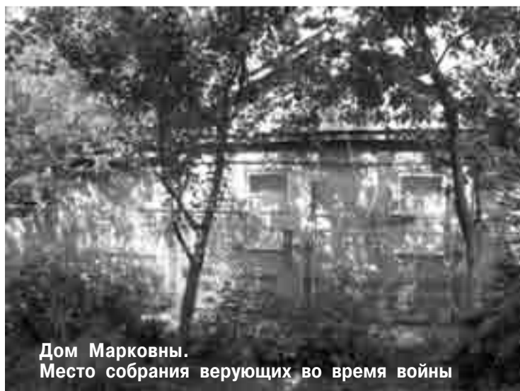
Дом Марковны. Место собрания верующих во время войны

Подготовил к публикации Юрий КРИВОНОС Продолжение в следующем номере Полную версию статьи вы можете прочитать на сайте www.vifania.ru