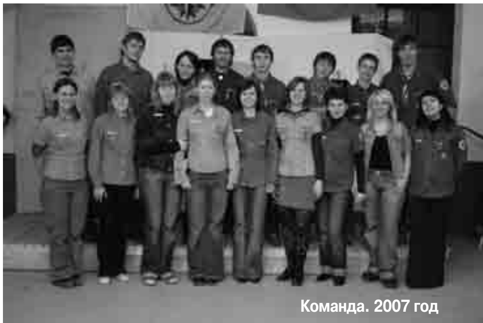
Команда. 2007 год