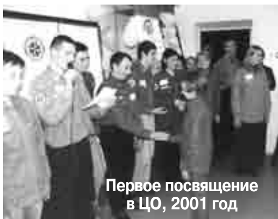
Первое посвящение в ЦО, 2001 год

- Когда в школе заполняют графу «чем дети увлекаются», я с радостью пишу: «Царские охотники». У меня все спрашивают, что это, и я рассказываю. Мои дети ходят на школьные утренники в униформе «ЦО». Для моего старшего сына это была первая возможность засвидетельствовать о том, что он христианин.