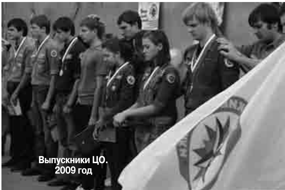
Выпускники ЦО. 2009 год

13 ноября 2009 года служение «Царские охотники» отмечает свой восьмой день рождения!