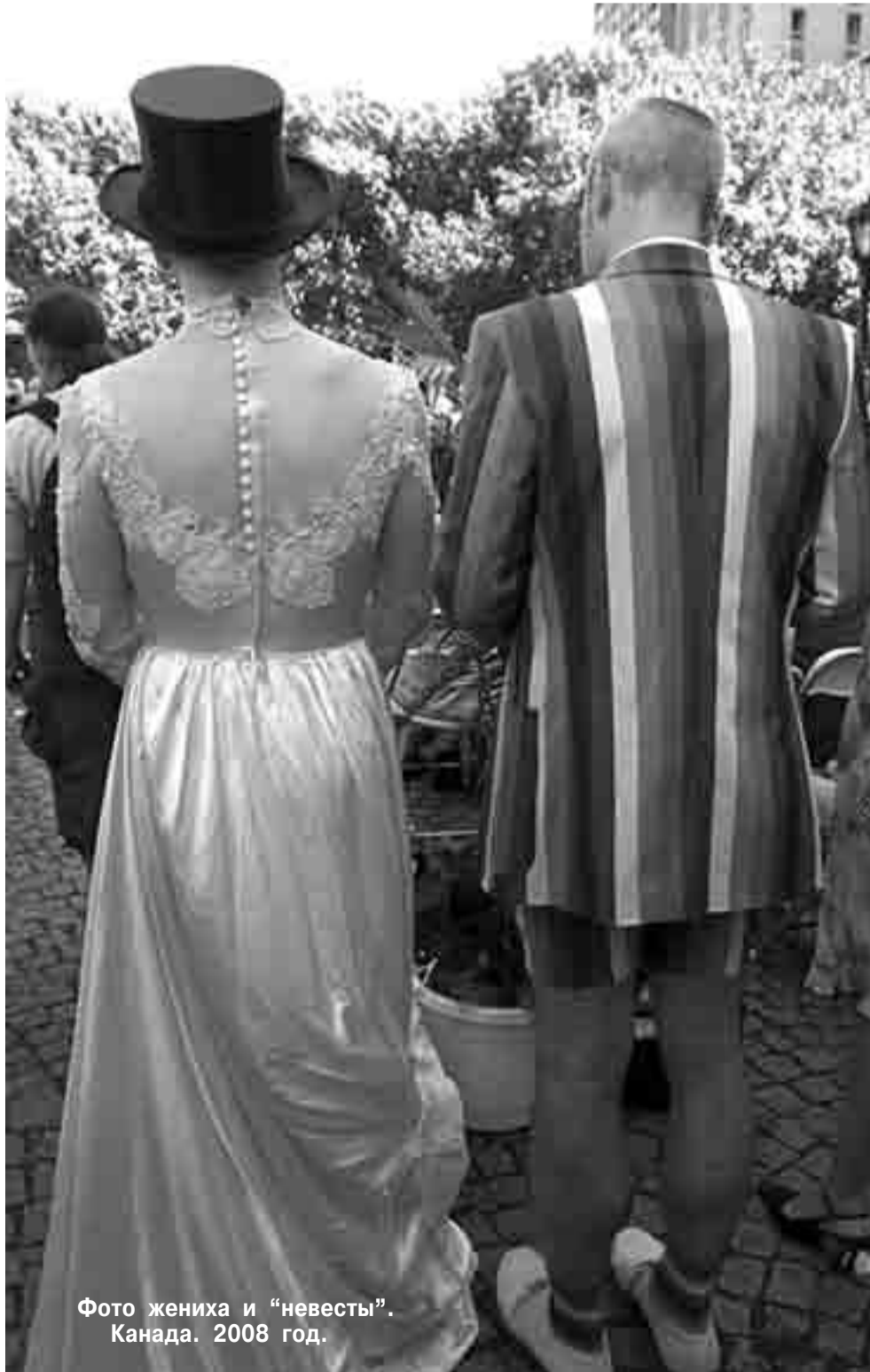
Фото жениха и «невесты». Канада. 2008 год.