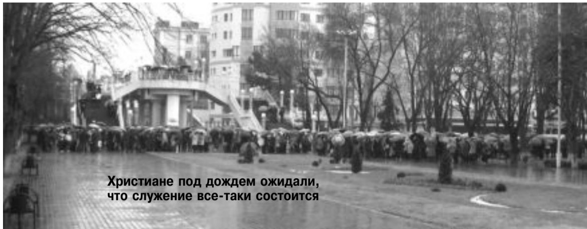
Христиане под дождем ожидали, что служение все-таки состоится