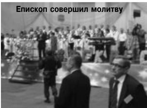
Епископ совершил молитву

4 апреля, в день Светлого Христова Воскресения за 15 минут до начала торжественного Богослужения поступил звонок о том, что здание Дворца спорта «Олимп», где должно было пройти собрание, заминировано. Наряды милиции перекрыли все входы и подъезды к помещению спорткомплекса, у входа и на подъездах к зданию собралось много верующих (около 2-3 тыс., при наличии внутри помещения ещё 1,5 тыс. человек), стремившихся попасть на служение. Сотрудники милиции объявили общую эвакуацию из здания. Возникло недоумение – никто не ожидал подобного, казалось, что всё не серьёзно и сейчас служение будет продолжено. Но непреклонность действий милиции и появление сотрудников в касках, бронежилетах и с автоматами на перевес не оставили сомнений в происходящем.