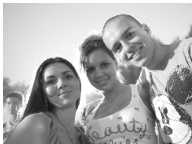
О молодежном христианском фестивале.