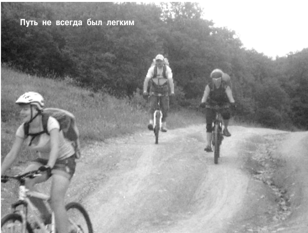
Путь не всегда был легким