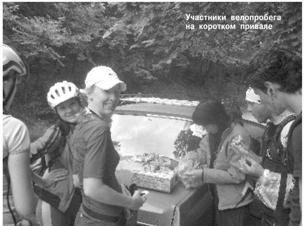
Участники велопробега на коротком привале