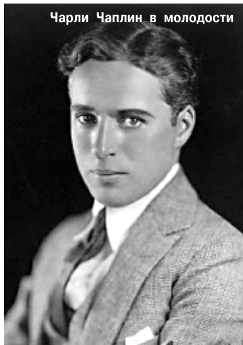
Чарли Чаплин в молодости

Я хорошо знаю это, и все же мне кажется, что в ночной тишине я слышу твои шаги, вижу твои глаза, которые блестят, словно звезды на зимнем небе. Я слышу, что ты исполняешь в этом праздничном