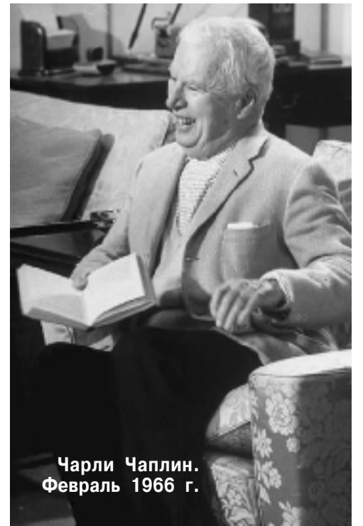
Чарли Чаплин. Февраль 1966 г.