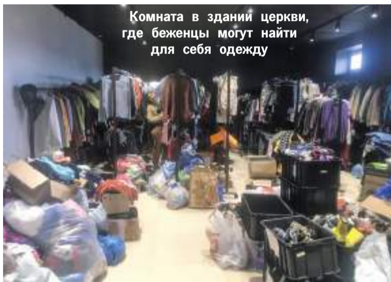
Комната в здании церкви, где беженцы могут найти для себя одежду

– Нет, таких мыслей никогда не было. Я знаю, что призван Богом помогать людям, попавшим в беду. И это невероятная радость – быть в том месте и в то время, где тебя хочет видеть Бог. Смотреть в глаза этих людей и понимать, что Христос, живя на земле сейчас, делал бы для них то же самое.