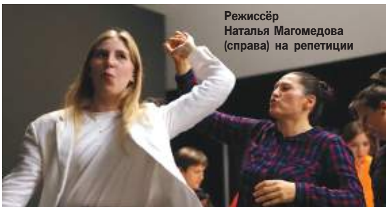
Режиссёр Наталья Магомедова (справа) на репетиции