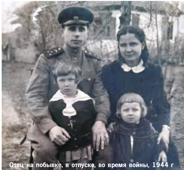
Отец на побывке, в отпуске, во время войны, 1944 г