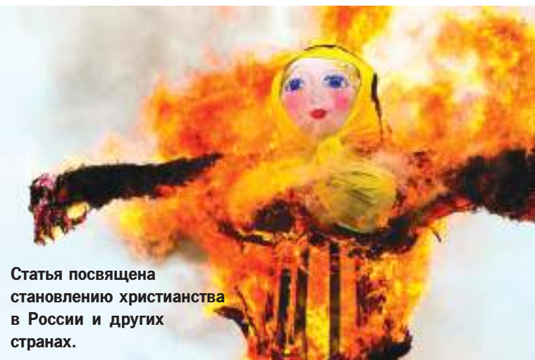
Статья посвящена становлению христианства в России и других странах.

Отмечается факт слияния языческих и христианских традиций в процессе формирования церковного календаря разных конфессий христианства, а также лояльное отношение к данному явлению со стороны официальной церкви.