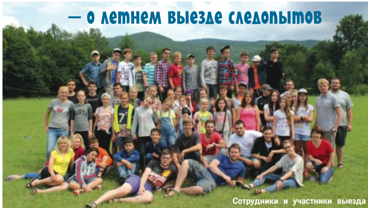
Сотрудники и участники выезда