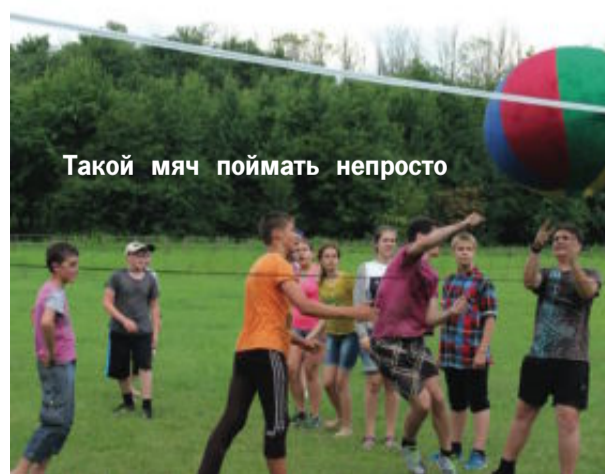
Такой мяч поймать непросто